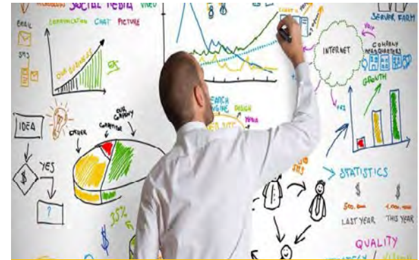
Positionnement dans les réseaux EDD