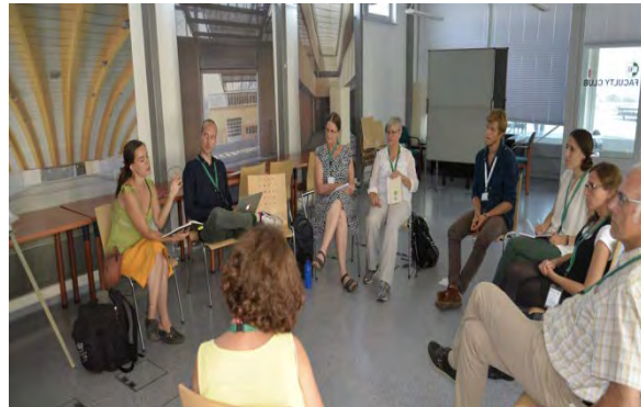
Atelier "Vision-&-Action" de Girona, 2019