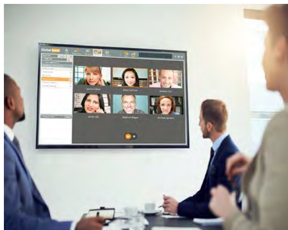
Co-creation à distance