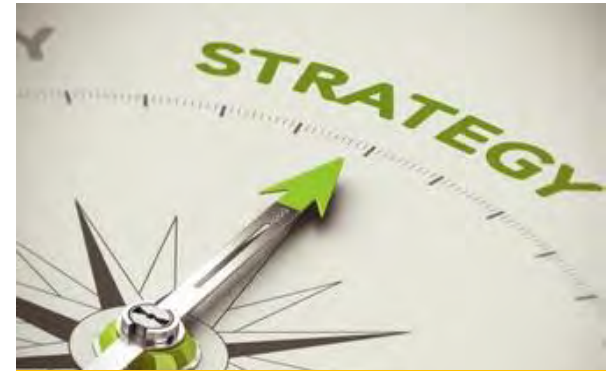
"Respect, engagement, collaboration"