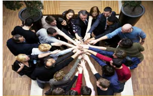
Charte de 1993 Relancement en 2009